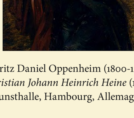
Moritz Daniel Oppenheim (1800-1882), Christian Johann Heinrich Heine (1831), Kunsthalle, Hambourg, Allemagne.